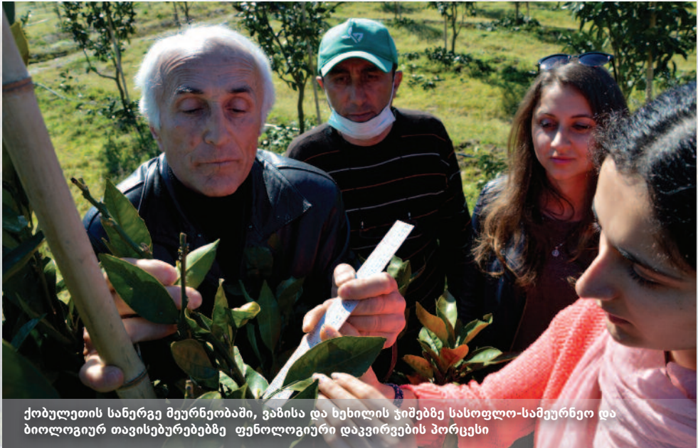
ქობულეთის სანერგე მეურნეობაში, ვაზისა და ხეხილის ჯიშებზე სასოფლო-სამეურნეო და ბიოლოგიურ თავისებურებებზე ფენოლოგიური დაკვირვების პორცესი

პროგრამა მთელი ქვეყნის მასშტაბით იმოქმედებს, მისი სოფლის განვითარების კონკრეტული პროექტები კი შერჩეულ მუნიციპალიტეტებში განხორციელდება.