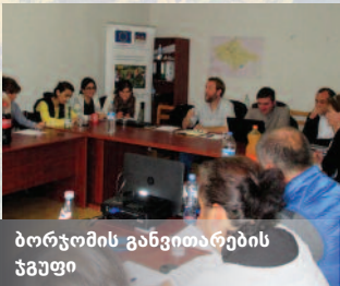
ბორჯომის განვითარების ჯგუფი

სტრატეგია ევროკავშირის მიერ გამოცდილ და მხარდაჭერილ „ლიდერ“-ის (LEADER) მეთოდოლოგიის მიხედვით ხორციელდება, რომელზე დაყრდნობითაც ბორჯომში, ყაზბეგსა და ლაგოდეხში ENPARD I-ის ფარგლებში დაწყებული საპილოტე პროექტები უკვე მიმდინარეობს. „ლიდერ“-ის პრინციპის თანახმად, ყოველ სოფელს განსაკუთრებული შესაძლებლობები და უნიკალური გამოწვევები გააჩნია, რის შესახებაც ყველაზე კარგად ადგილობრივი მოსახლეობისთვისაა ცნობილი. მიდგომა გულისხმობს ე.წ. „ქვემოდან-ზევით“ პრაქტიკის დანერგვას, რომლის თანახმადაც სამოქმედო გეგმისა და გადაწყვეტილებების მიღება პროექტის საბოლოო ბენეფიციარების მონაწილეობით ხდება. ENPARD-ის პროგრამის ფარგლებში, ადგილობრივი განვითარების ჯგუფები (LAG) თემების მობილიზაციას ახდენენ და მათი მონაწილეობით კეთილსამედო საპროექტო განაცხადებს დაფინანსებისთვის შეარჩევენ.