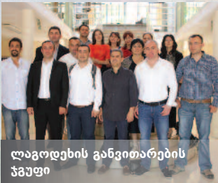
ლაგოდეხის განვითარების ჯგუფი