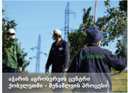
აჭარის აგროსერვის ცენტრი ქობულეთში - შენამღვის პროცესი

სტანდარტების დანერგვაშიც შეუწყობს ხელს. ამასთან, მოხდება საზღვარზე არსებული შემონღმებისა და კონტროლის მექანიზმების გაძლიერება, იმპორტირებული და ექსპორტირებული სურსათის სტანდარტების გაუმჯობესება და ფერმერთა წახალისება, რათა მათ აღნიშნულ სტანდარტებთან შესაბამისობაში მყოფი პროდუქცია აწარმოონ. ფერმერთა მიერ სტანდარტების დაცვა ძალზე მნიშვნელოვანია, მითუმეტეს თუ ისინი პროდუქციის გატანას DCFTA-ის მეშვეობით ევროპის ბაზარზე გეგმავენ.