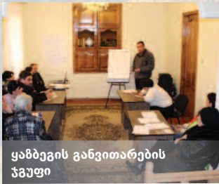
ყაზბეგის განვითარების ჯგუფი

სოფლად სამუშაო ადგილების შექმნა და საცხოვრებელი პირობების გაუმჯობესება ეკონომიკის დივერსიფიკაციას უწყობს ხელს, და ამასთან, სოფლის მეურნეობაზე დამოკიდებულებასაც ამცირებს.